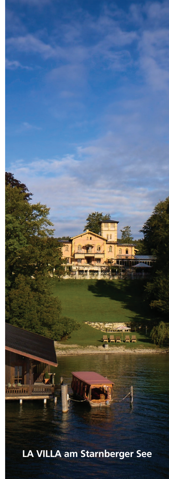
LA VILLA am Starnberger See

Seit über 160 Jahren schafft die WMF Group kostbare Momente beim Kochen und Genießen. In mehr als 200 Standorten und Filialen werden knapp 6.000 Mitarbeiter in mehr als 90 Ländern beschäftigt. Als Tochterunternehmen der französischen Groupe SEB ist die WMF Group seit 2016 Teil eines internationalen Teams aus weltweit 33.000 Mitarbeitern. Als führender Premiumhersteller von Besteck, Tisch- und Küchenprodukten für den Haus- und Gastronomiegebrauch sowie Kaffeefullautomaten für den professionellen Einsatz bietet das Unternehmen innovative Produkte höchster Qualität mit anspruchsvollem Design und hervorragender Funktionalität.